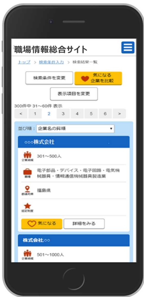
検索結果一覧画面