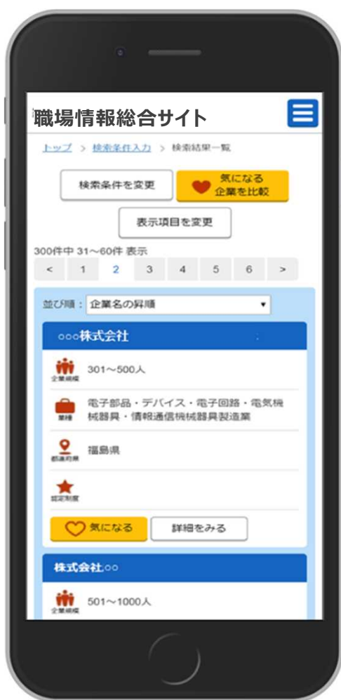
検索結果一覧画面